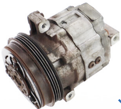
Kompletní díl bez chybějících částí a poškození